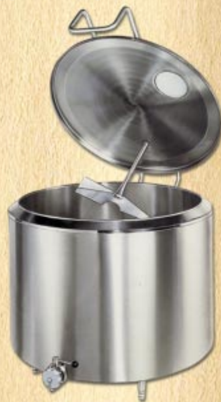
Refrigeratore latte da stalla

CR INOX IMPIANTI ATTREZZATURE ED IMPIANTI PER IL LATTE E LA SUA TRASFORMAZIONE