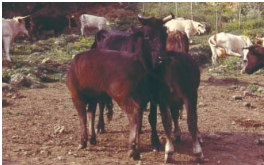
Vacca di razza Cinisara con due gemelli F1 marchigiani