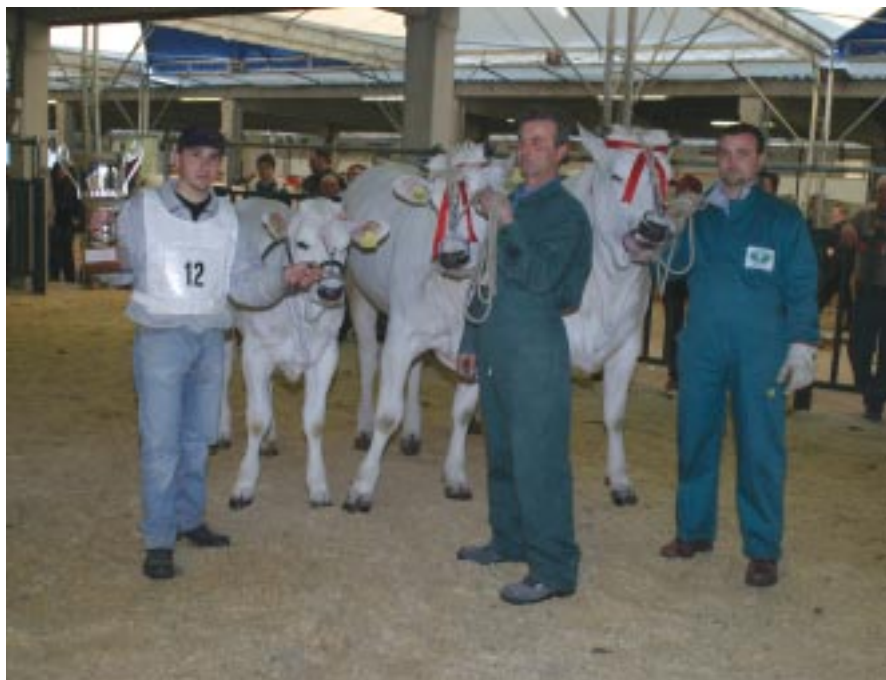
Miglior gruppo di allevamento (azienda Luchetti - PG)