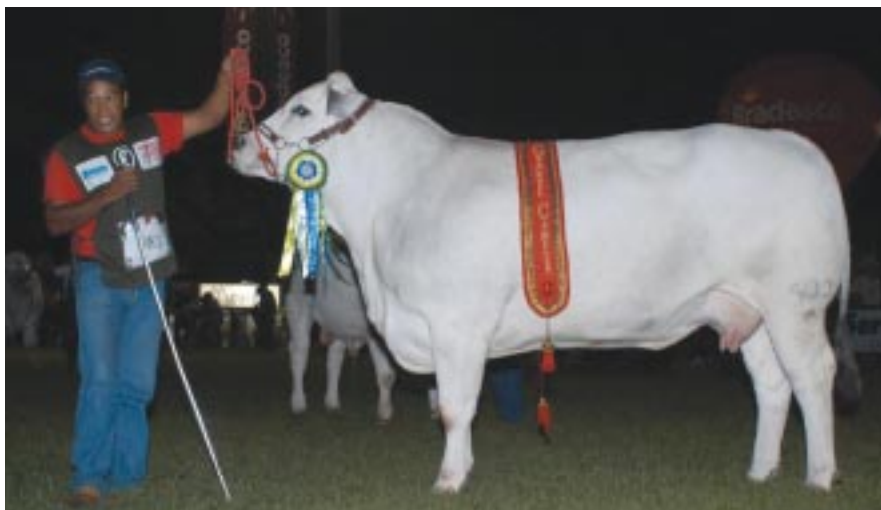
La campionessa assoluta di mostra Valenza da Cachoeira