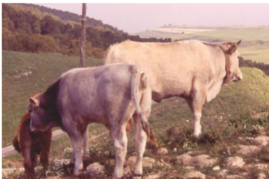
Incroci F1 marchigiani

L'obiettivo dell'incrocio con tori da carne è quello di ottenere vitelli in grado di assicurare prestazioni produttive redditizie nelle fasi di allevamento, ingrasso e macellazione. La scelta dei riproduttori nella linea vacca-vitello deve rispondere ai seguenti criteri, attitudine alla produzione di carne, spiccata rusticità,