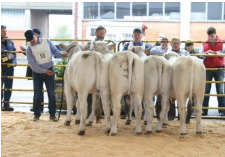
Il "meglio" della seconda categoria femmine; la prima a sinistra è Ville Unite Perseide, prima classificata di categoria e campionessa di riserva junior della mostra.