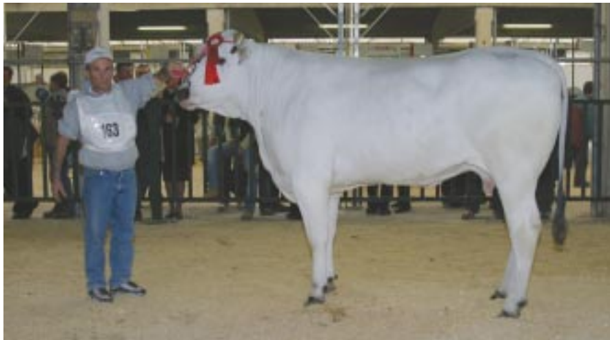
Miss Jenny, campionessa riserva senior di mostra (azienda il Colle - FI)