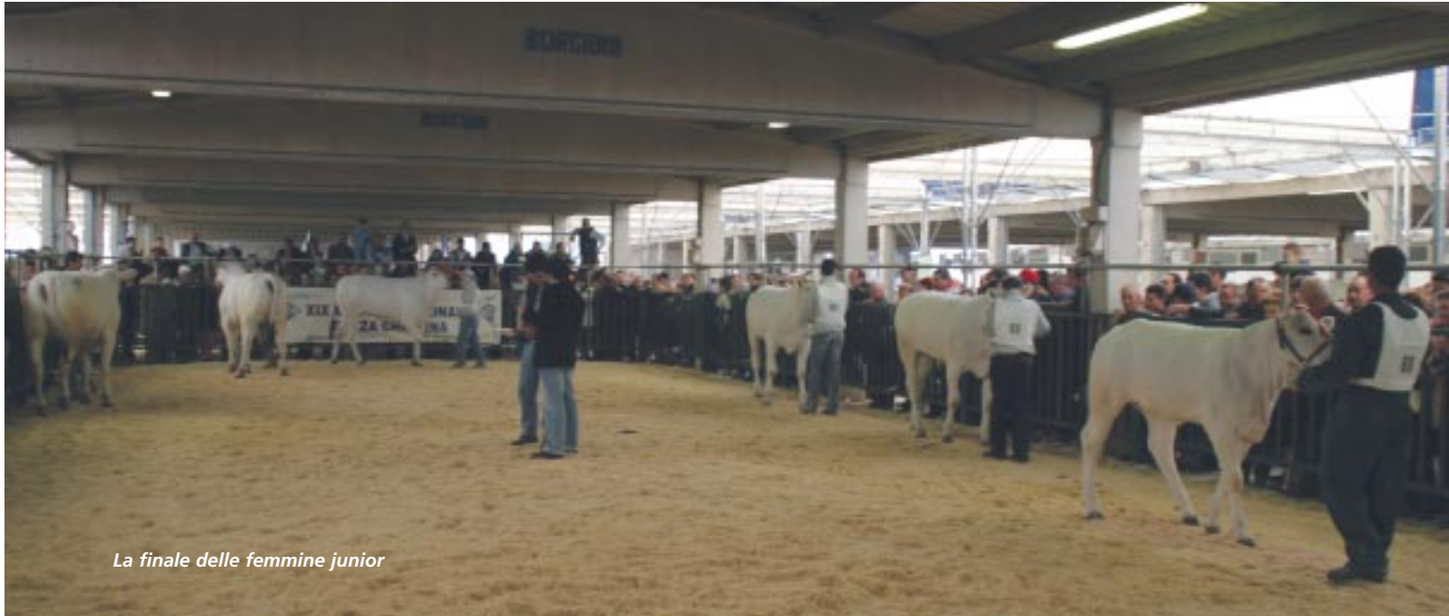
La finale delle femmine junior