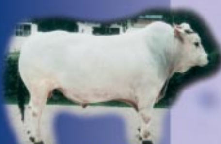
BIRBO Marchigiana Matricola/Tattoo: AN 123271 Nato/Born: 20 - 11 - 1992

Italiana Genetica e Servizi San Martino in Colle 06070 Perugia Tel. + 39 (0)75 6079201 Fax 607598 Website: www.anabic.it E-Mail: igs@anabic.it