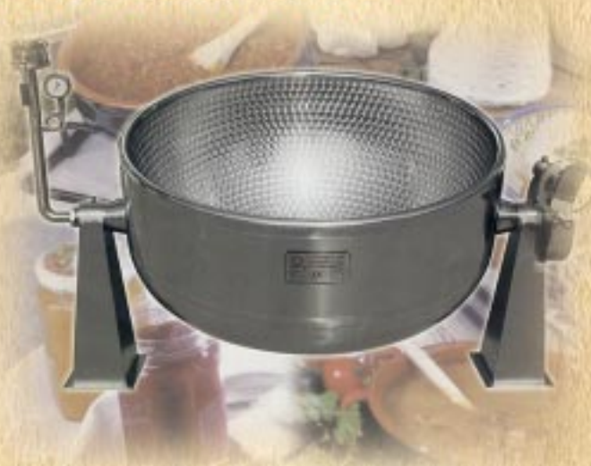
Doppiofondo per ricotta