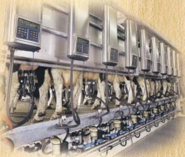
Sala di mungitura

Tel. e Fax 075.396663 - Cell. 338.2436532 / 338.7485202