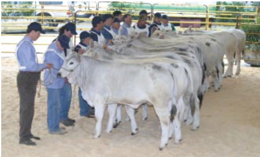
L'impressionante uniformità della prima categoria femmine