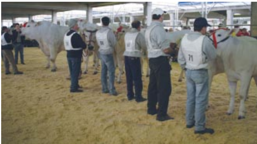
Soggetti in gara per l'assegnazione del Trofeo Chiacchierini