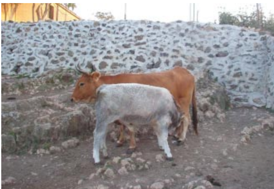
Vacca indigena siciliana con vitello F1 marchigiano

225±10 kg, sono stati formati 2 gruppi omogenei per numero, peso