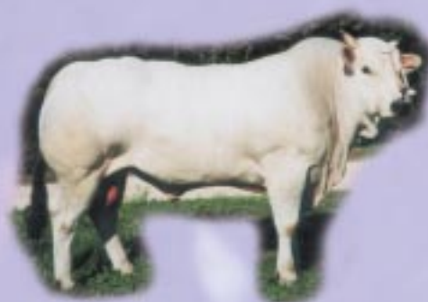
LOTAR Marchigiana Matricola/Tattoo: 51ITO42000030051 Nato/Born: 24 - 07 - 1999