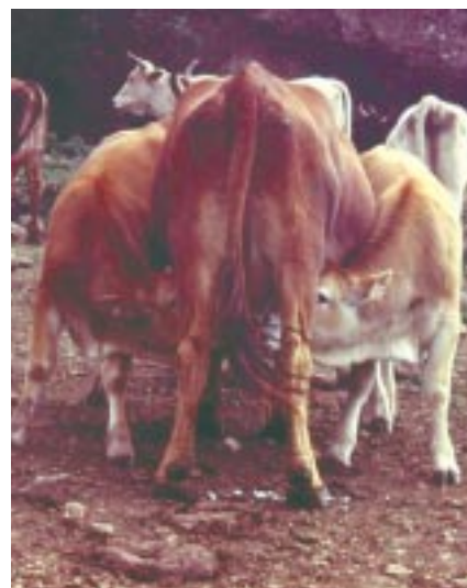
Vacca di razza Modicana con due gemelli meticci marchigiani

Ad aggravare la situazione negli ultimi anni si è aggiunta la vicenda della "mucca pazza" che grazie alla disinformazione dei media ha reso il prodotto carne bovina sospetto