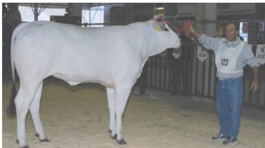
Oliva, campionessa junior di mostra (azienda Il Colle - FI)