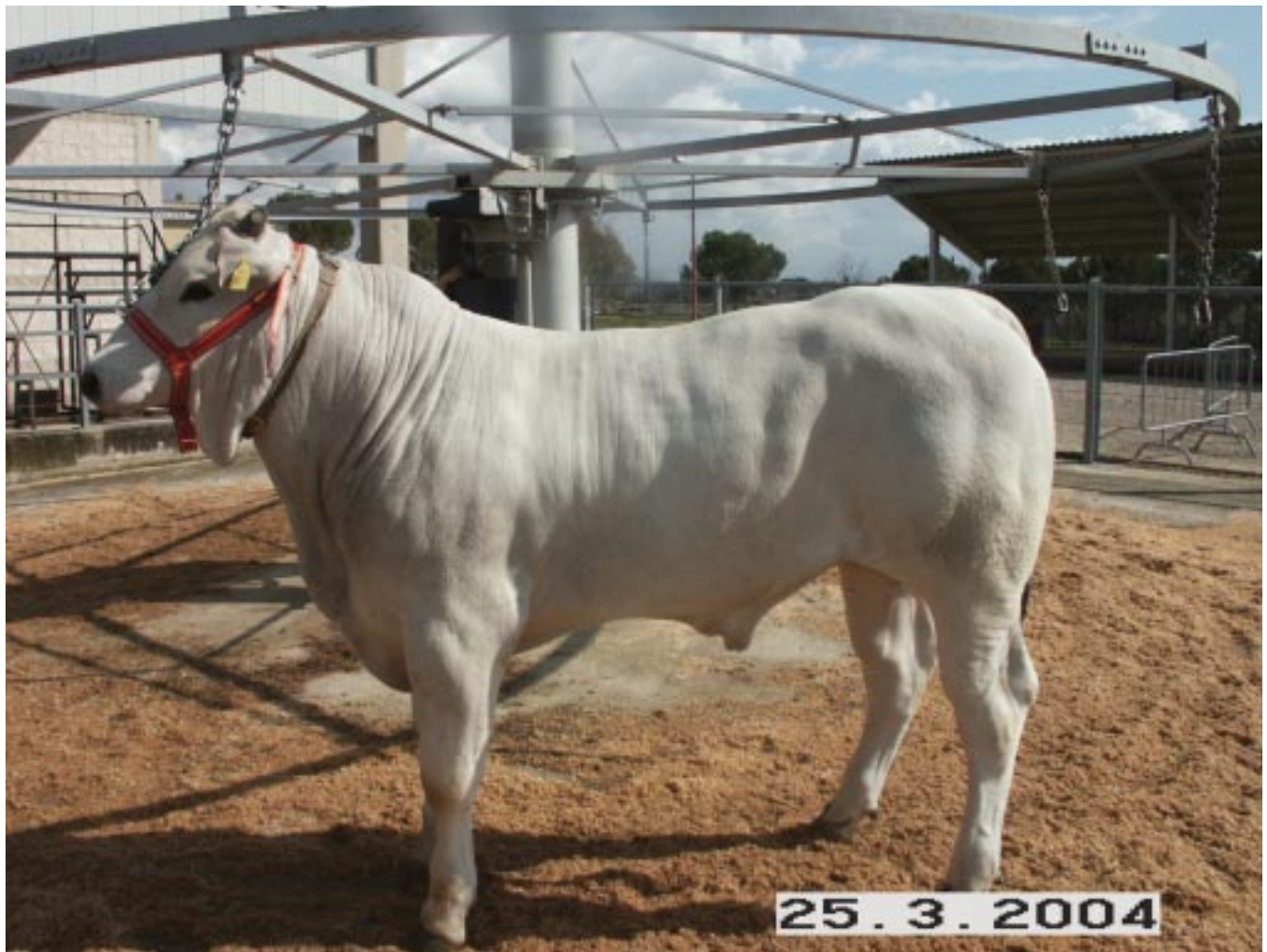
Pedro della Favorita

riore le successive quotazioni, che hanno visto aggiudicati ad una media di 2.600 euro tutti i restanti soggetti venduti in asta.