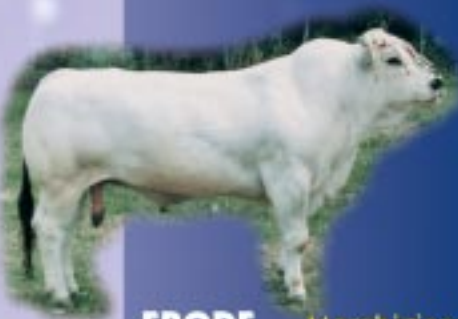
ERODE Marchigiana Matricola/Tattoo: PS 116651 Nato/Born: 07 - 06 - 1995