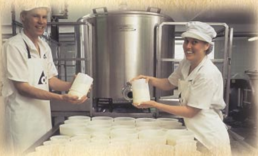
Polivalente e tavolo per la trasformazione del latte in formaggio