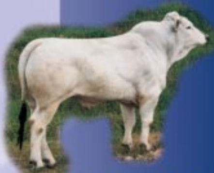
ETTORE Chianina Matricola/Tattoo: SI 132821 Nato/Born: 24 - 12 - 1995