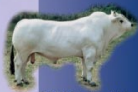
DAINO Marchigiana Matricola/Tattoo: MC 130819 Nato/Born: 20 - 10 - 1994

Italiana Genetica e Servizi San Martino in Colle 06070 Perugia Tel. + 39 (0)75 6079201 Fax 607598 Website: www.anabic.it E-Mail: igs@anabic.it