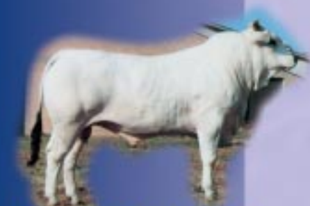
DAMASCO Marchigiana Matricola/Tattoo: MC 131056 Nato/Born: 11 - 09 - 1994