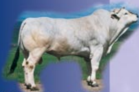
DEODATO Chianina Matricola/Tattoo: SI 129233 Nato/Born: 28 - 04 - 1994