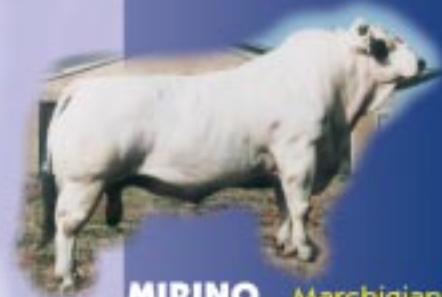
MIRINO Marchigiana Matricola/Tattoo: PE 105642 Nato/Born: 04 - 01 - 1990

Semen and embryos available all over the world