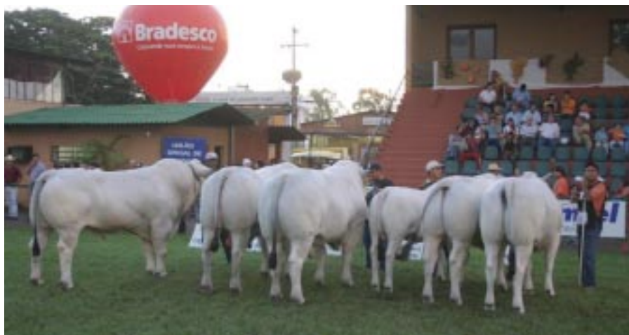
Il giudizio della razza Marchigiana a Londrina