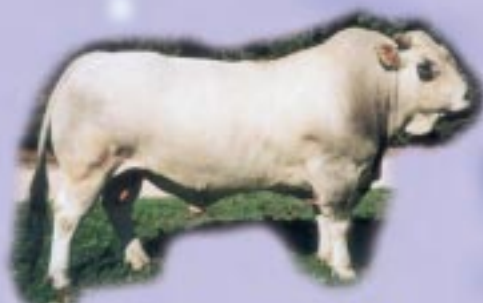
ISIDORO Marchigiana Matricola/Tattoo: 51IT007PS029C035 Nato/Born: 12 - 04 - 1998